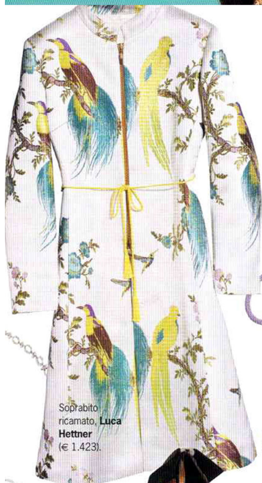
Soprabito ricamato, Luca Hettner (€ 1.423).

Abiti a kimono, plateau scultorei, ventagli e cinture obi. Molto giapponesi e sensuali. Per alludere al tuo essere (qualche volta) geisha