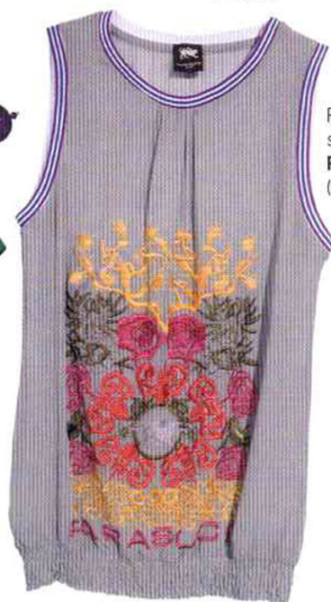
Ricami multicolor sul top, Parasuco Cult (€ 120).