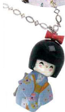
Ciondolo a bambolina Kokeshi, Lilla Bluma (€ 88).