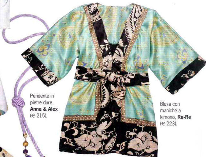
Pendente in pietre dure, Anna & Alex (€ 215).