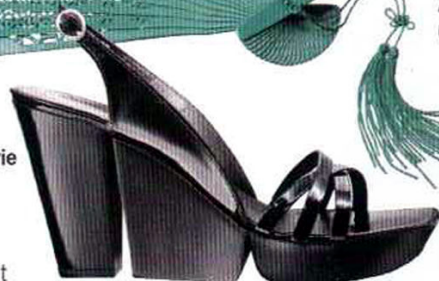
Zeppa scultorea per il sandalo, Robert Clergerie (€ 345).