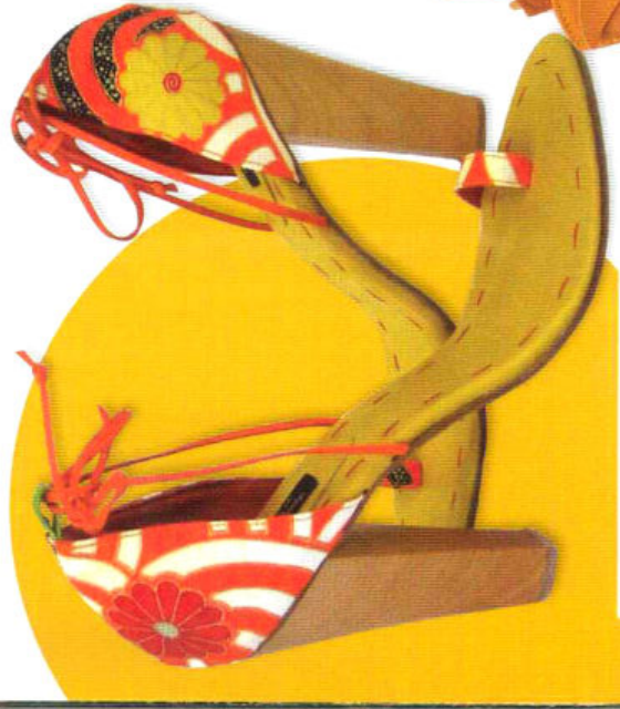
« Kinomoo Collection » Sandali monodito di sapore orientale. Particolarità: il tessuto vintage ispirato al Sol Levante. Hetty Rose (€ 400)

Accessori d'estate: libera interpretazione sul tema